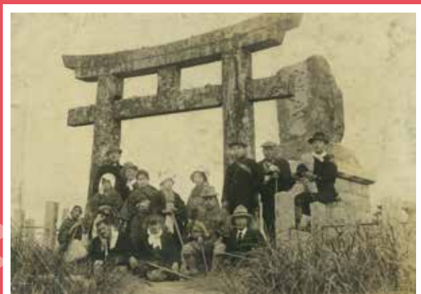
宝満山中宮跡に立つ「龍門山碑」の前で 大正 14 年 (1925) 個人蔵