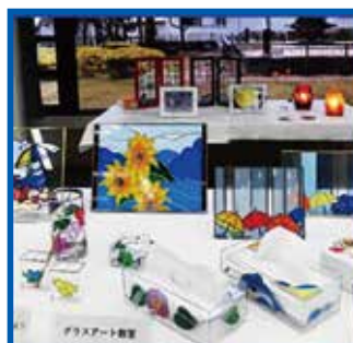
ガラスアート教室