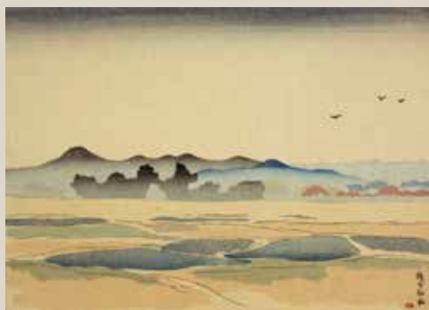
坂本繁二郎「稷寺神社」福岡市美術館蔵