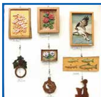
ふれあい木彫りサークル