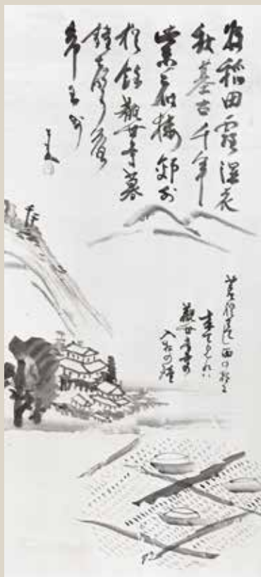
仙厓「都府楼図」福岡市美術館蔵