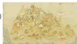
「宝満山絵図(西図)」 福岡県立美術館蔵