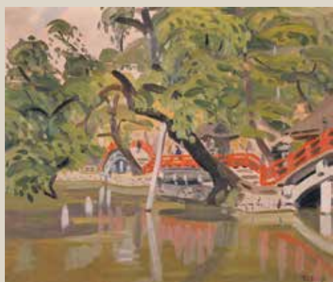
中村琢二「太宰府の秋」福岡県立美術館蔵