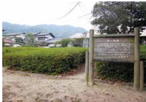
浦ノ城跡(太宰府市連歌屋 浦之城公園)