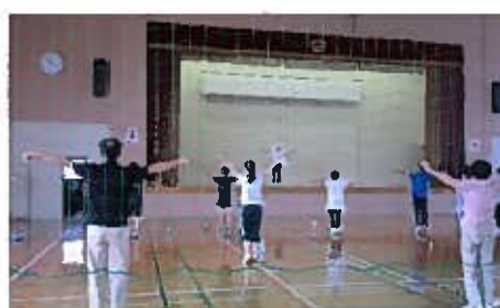
正しいラジオ体操講座

自宅でもできるストレッチや、骨盤を整える骨盤ウォーキングを楽しく学べる講座を開催しました。