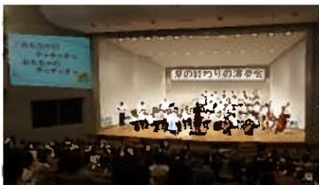
夏の終わりの演奏会

九州大学芸術工学部フィルハーモニー管弦楽団「ひまわりオーケストラ」による、親子向けのコンサートを開催しました。