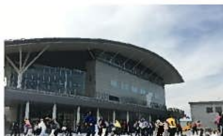
史跡のまちのラジオ体操