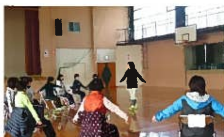
からだポカポカ講座

自宅でもできるストレッチや、骨盤を整える骨盤ウォーキングを楽しく学べる講座を開催しました。