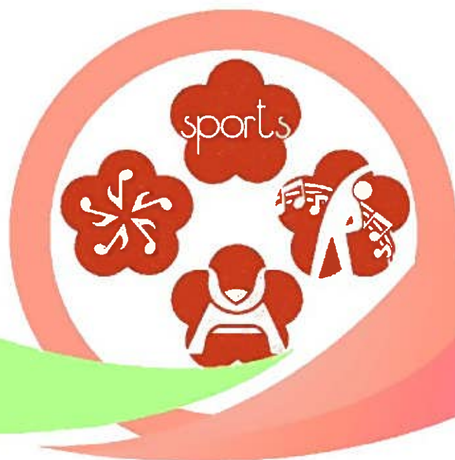
史跡のまちのスポーツ体験