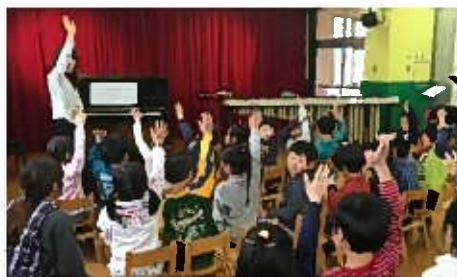
史跡のまちの音楽隊

実力ある演奏家を地域へ派遣し、演奏家との交流を交えた訪問演奏およびブラム・カルコア太宰府でのコンサートを開催しました。