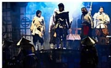
史跡のまちの“生”歴史ドラマ

太宰府市の歴史・史跡等に基づいた舞台公演、および歴史講座やコンサートを開催しました。